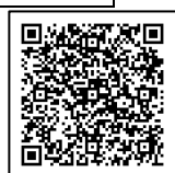
ごみの分け方・出し方