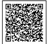
魅力あるまちづくり カブアップ 応援補助金