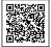
町ホームページ 観光サイト