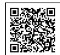
申し込みフォーム