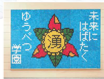
■令和4年度在校生による「開校記念制作」