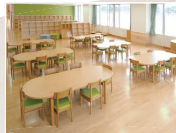
■図書コーナー・多目的スペース2