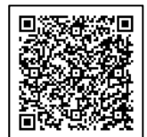
まちづくり出前講座