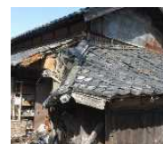
緊急代執行を要する崩落しかけた屋根