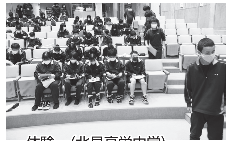
体験 (北見高栄中学)