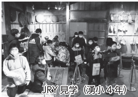
JRY 見学 (湧小4年)

湧別小学校4、6年生は、それぞれ3回ずつの利用がありました。また富美小学校5、6年生は初のオンライン授業を行いました。