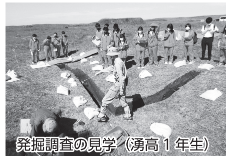
発掘調査の見学 (湧高1年生)