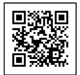
大会エントリーページ

パソコンまたはスマートフォンから大会エントリーページ( https://runnet.jp/ )にてお申し込みください。支払方法は、お申し込みの際にクレジットカード、コンビニ、ATMなどからお選びいただけます。ただし、エントリー手数料がかかります。