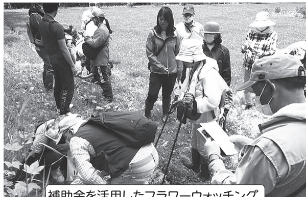
補助金を活用したフラワーウォッチング サギ沼・五鹿山 (R4.6.18,19 開催)