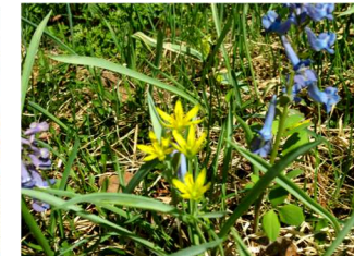
上:キバナノアマナと エゾエンゴサク(2020.5.9)