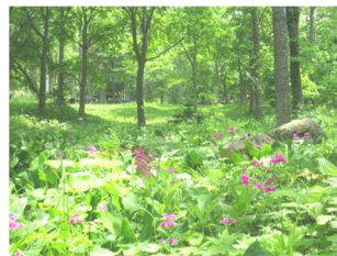
野鳥のさえずり(オオルリ)