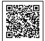
町ホームページ 観光サイト

【掲載場所】 町ホームページ観光サイト内 ( https://www.town.yubetsu.lg.jp/tourism/ )