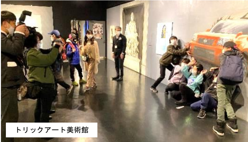
トリックアート美術館