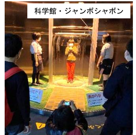
科学館・ジャンボシャボン