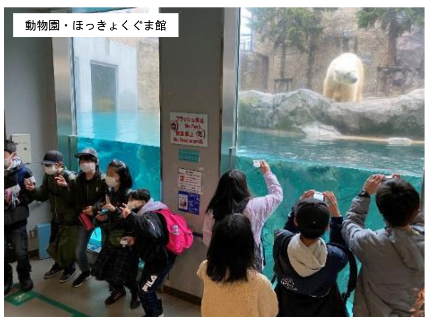
動物園・ほっきょくぐま館