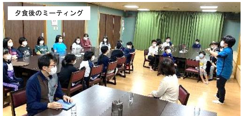
夕食後のミーティング