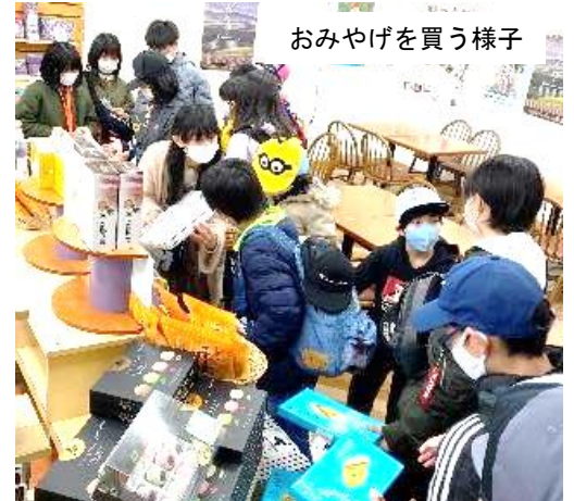
おみやげを買う様子