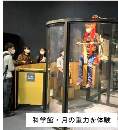
科学館・月の重力を体験