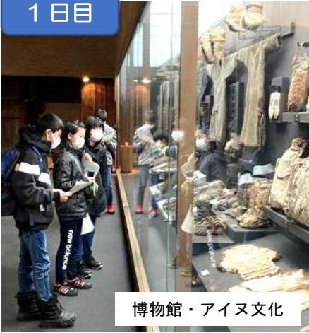
博物館・アイヌ文化