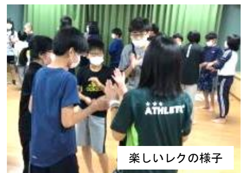
楽しいレクの様子