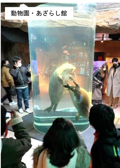
動物園・あざらし館