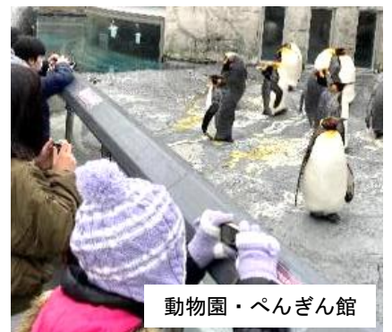
動物園・ペンギん館

今日は、お忙しい中私 たちのために時間をつ くってくれて、ありがとうご ざいました。これからも元氣 頑張ってください。 漢科町立漢科小学校 六年一組一同より