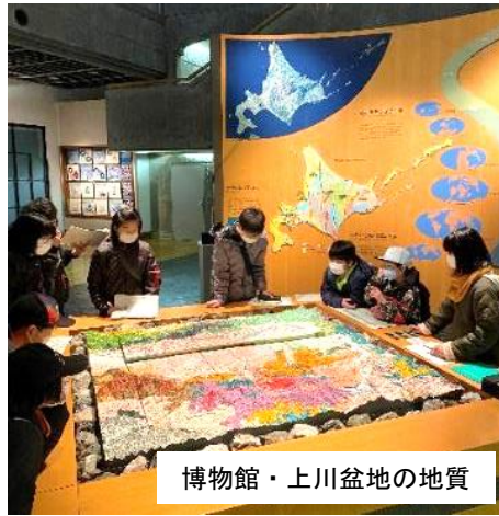
博物館・上川盆地の地質