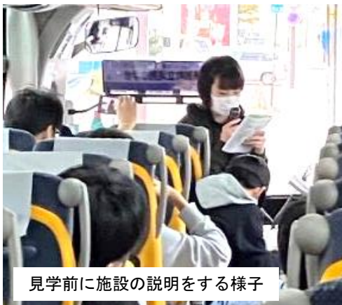
見学前に施設の説明をする様子