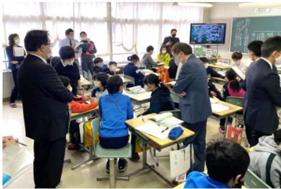
授業を公開した6年生学級の様子