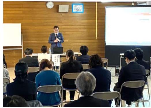
樺山准教授による講演会の様子