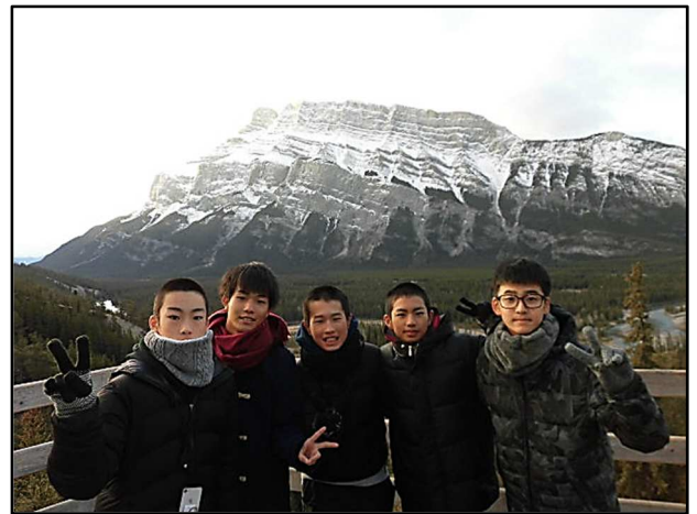
バンフ国立公園 フードゥーズ

今日はバンフ国立公園の見学です。今朝の気温は3度。思ったより寒くなく、空気が冷たくない感じです。まず始めの見学地はフードゥーズです。ガイドさんに説明を受けながら、素晴らしい景色に歓声があがっていました。フードゥーズに向かう途中には早速エルクの群れを発見！こんなに早く野生動物を見られるなんて、ラッキー!!ですね。オス1頭とメスが数頭の群れで、野生のエルクについても色々教えてもらいました。フードゥーズの後はボウフォールの上まで階段を登り、滝を上からと下からの両方から見学。またまた綺麗な景色を楽しみました。すでに雪が降っていて、道路にはサラッと雪が積もっていますが、それほど寒くなく空気が澄んでいて景色がとても綺麗です。