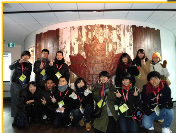
サルファーマウンテン博物館