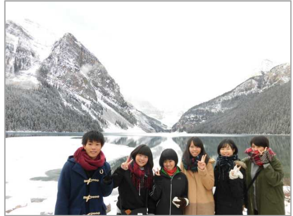
レイク・ルイーズ

午前中最後の見学地は、レイク・ルイーズです。今年はまだそれほど気温も下がってはなく、先週まで暖かかったそうですが、すでに湖の一部が凍り始めていて、それはそれで、とても綺麗でした。ここでは恒例のジャンプ写真を撮影。写真を撮る準備をしながら並んでいると、通り掛かりのお姉さんも飛び入りで参加してきて、一緒にジャンプしてくれました。今年は人数が多いからどうかと思いましたが、けっこうすぐにいい写真が撮れました！