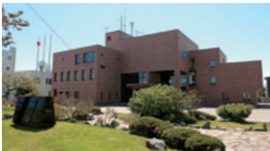
湧別町総合支所 紋別郡湧別町栄町112番地 ☎(01586)5-2211(代)