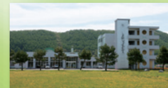
ケアハウス来夢 〒099-6501 紋別郡湧別町屯田市街地335番地の2 ☎ 01586-4-1100