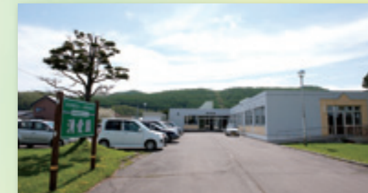
湧愛園 〒099-6501 紋別郡湧別町上湧別屯田市街地336番地の1 ☎ 01586-2-3151

自宅での生活が困難になった高齢者に対して、上湧別地区と湧別地区にそれぞれデイサービスセンターと特別養護老人ホーム「湧愛(ゆうあい)園」「オホーツク園」が整備されています。