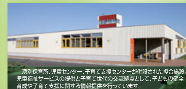
湧別保育所、児童センター、子育て支援センターが併設された複合施設。児童福祉サービスの提供と子育て世代の交流拠点として、子どもの健全育成や子育て支援に関する情報提供を行っています。

湧別町では、保育所を併設した2つの児童複合施設と3カ所の保育所により、子育て世代が安心して就労できる環境の整備に努めています。