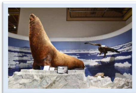
【湧別の雄大な自然】

ナウマンゾウ化石：芭露で発見された、ナウマンゾウの右上の歯の化石です。 約3万年前のものと考えられています。