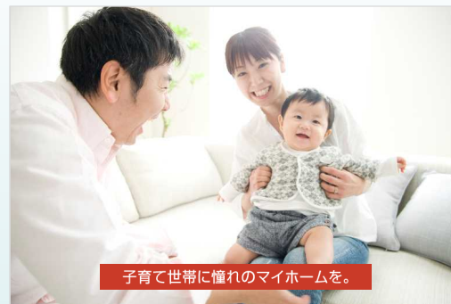
子育て世帯に憧れのマイホームを。