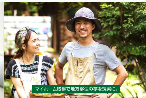
マイホーム取得で地方移住の夢を現実に。

【フラット35】子育て支援型・地域活性化型とは、子育て支援や地域活性化について積極的な取組を行う地方公共団体と住宅金融支援機構が連携し、地方公共団体の住宅取得に対する財政的支援とあわせて【フラット35】の借入金利を一定期間引き下げる制度です。