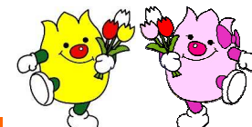
湧別町イメージキャラクター チュービットとリップちゃん