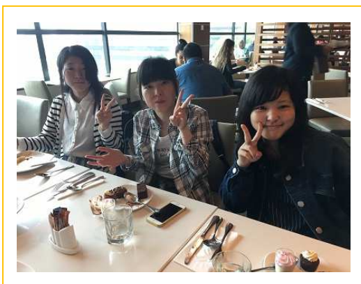
ランチを楽しむ女子

今日は久しぶりに湯船に浸かり、これまでの10日間を懐かしく思える時間になりそうです。でも、明日の朝は6時半にはホテルを出発！夕方には東京に到着します。