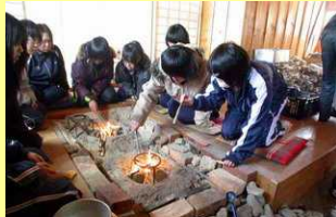
屯田生活体験館の囲炉裏で体験。 3グループ同時に体験可。