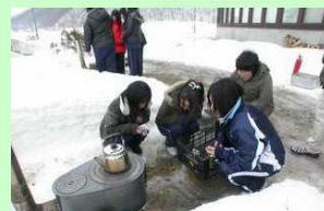
薪ストーブは全部で5台あります。 野外での体験が前提です。

火を育むことができたなら、お湯を沸かして お茶を飲んだり、別項の炊飯を体験したりします。