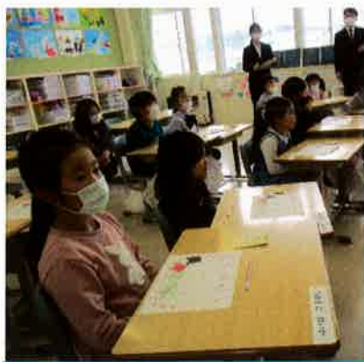
先生の話を上手に聞けました