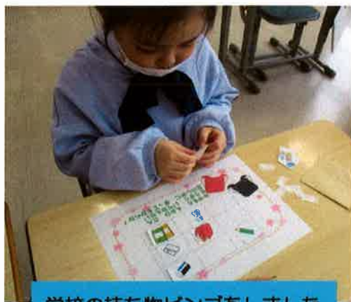
学校の持ち物ビンゴをしました