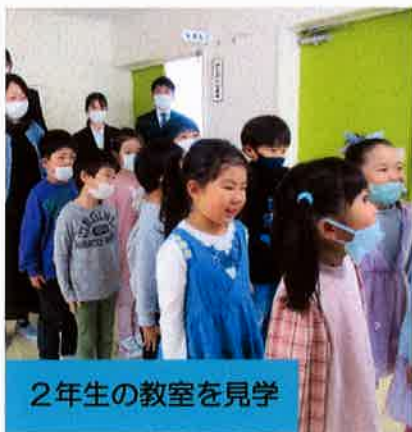
2年生の教室を見学

1月24日(水)に1日入学が行われ、来年度入学予定の18名が保護者と一緒に元気いっぱい登校しました。